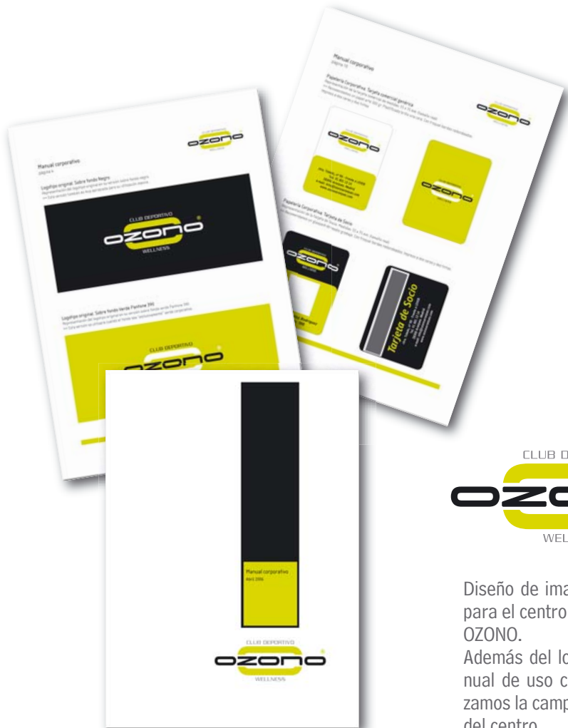
imagen corporativa creación de logotipos, marcas y manuales de aplicación