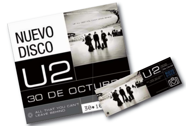
Flyers y Bus promocional