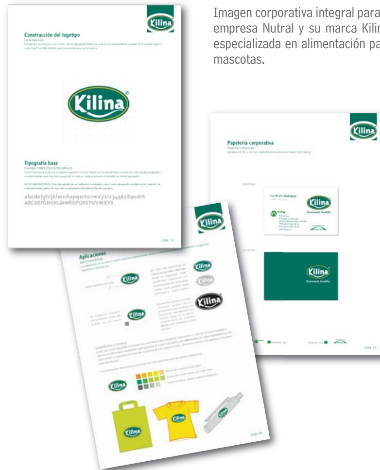
Imagen corporativa integral para la empresa Nutral y su marca Kilina, especializada en alimentación para mascotas.