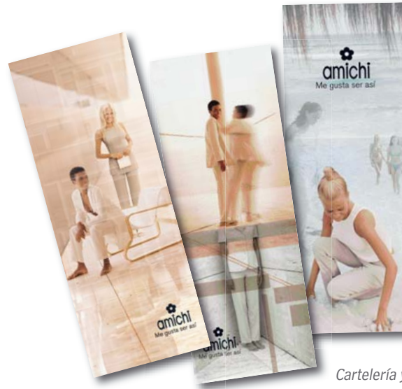
Cartelería y catálogos