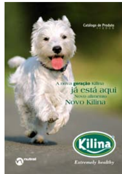
Catálogo de producto

Desde la imagen corporativa hasta las piezas de promoción en punto de venta, pasando por el diseño de toda su línea de productos. Kilina, un proyecto muy ambicioso que desarrollamos con la dirección de marketing del cliente, logrando piezas contundentes y muy satisfactorias para sus objetivos comerciales.