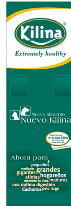
Displays porta folletos