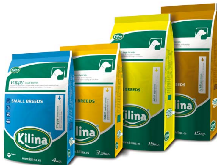
Extracto de la línea de sacos de producto