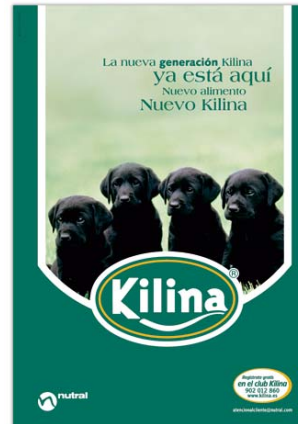
Visuales de prensa